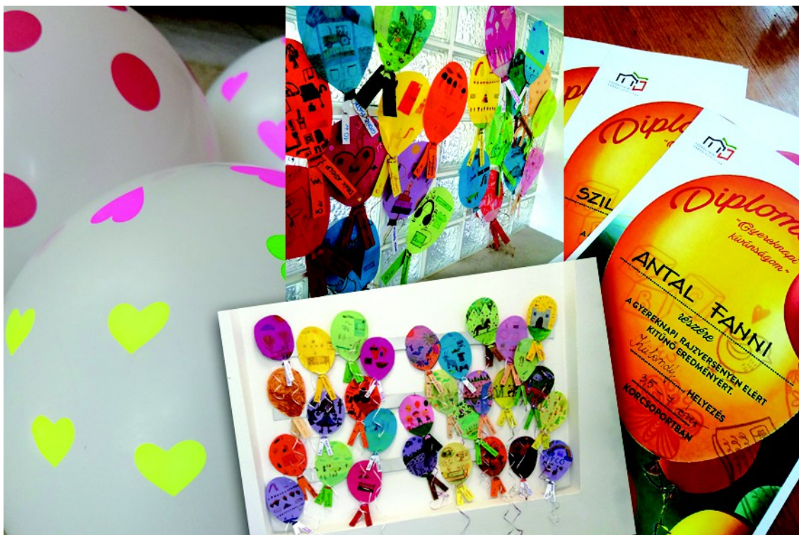
Figura 16 . – Expoziția desenele în forme de baloane ( mijloc ), diploma pentru concurs ( dreapta ), (2023)