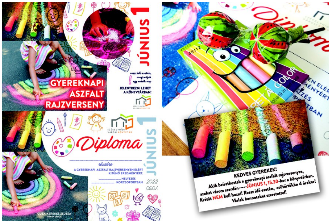
Figura 13. – Afișul și diploma pentru concurs ( stânga ), pliantul pentru concurs ( dreapta ), (2022)