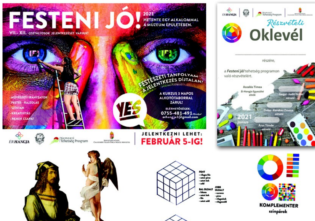
Figura 24 . – Afișul și diploma pentru proiect (sus), fișe de exerciții pentru curs (jos), (2021)