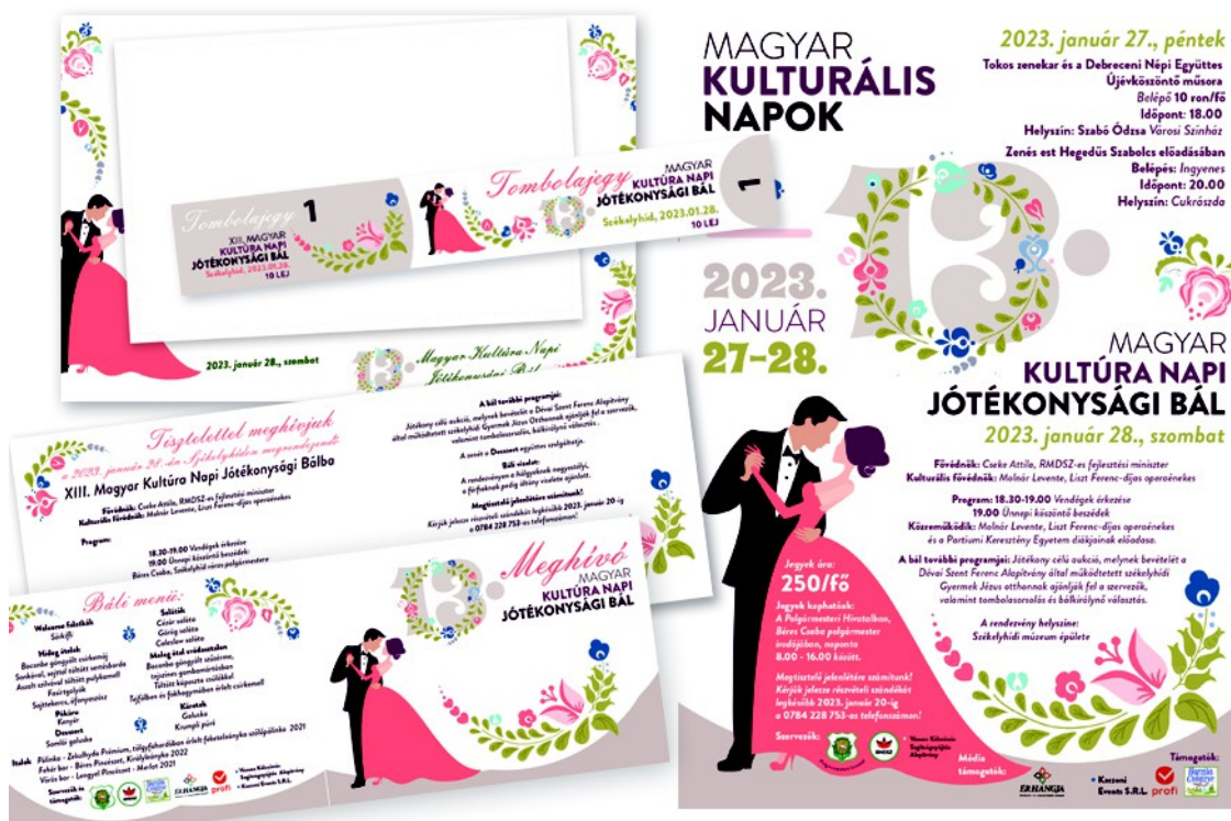
Figura 25. – Proiectul vizual pentru Balul caritabil de Ziua Culturii Maghiare, ramă de foto, tombola, invitație (stânga), afiș dreapta), (2023)