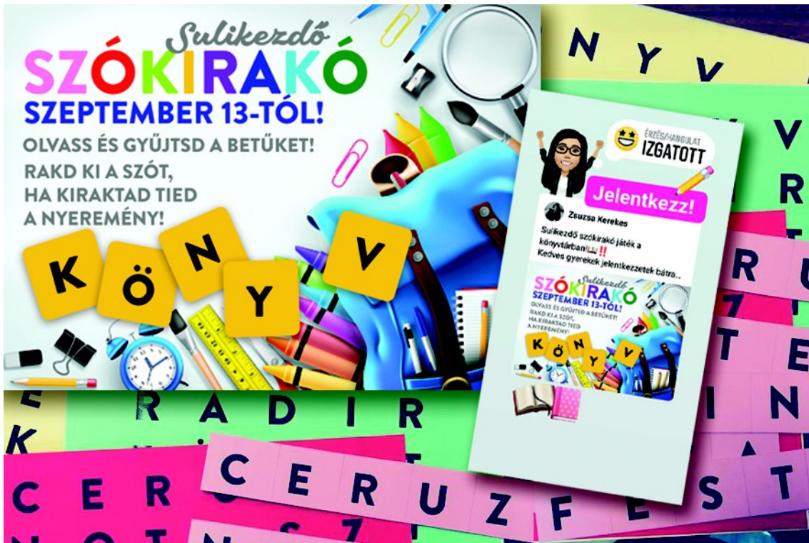
Figura 17 . – Afişul pentru joc (stânga), pliantul online pentru joc (dreapta), literele de ”puzzle” pentru joc (background) (2021)