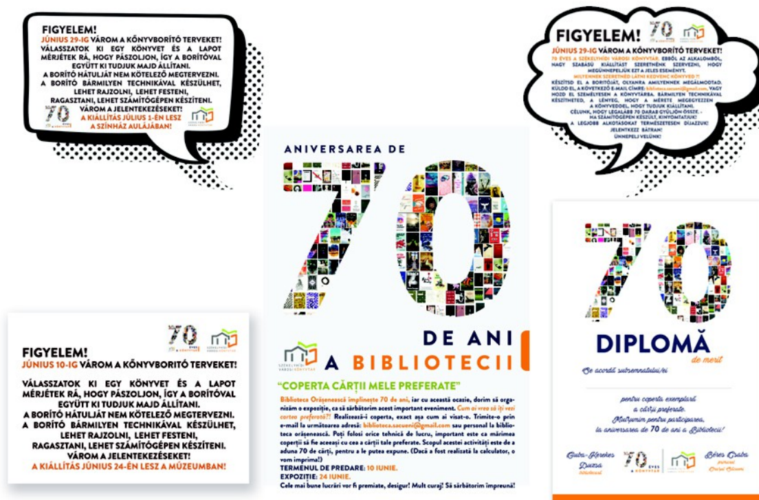
Figura 26. – Proiectul vizual pentru aniversarea bibliotecii, pliant, afiș și diplomă (2022)