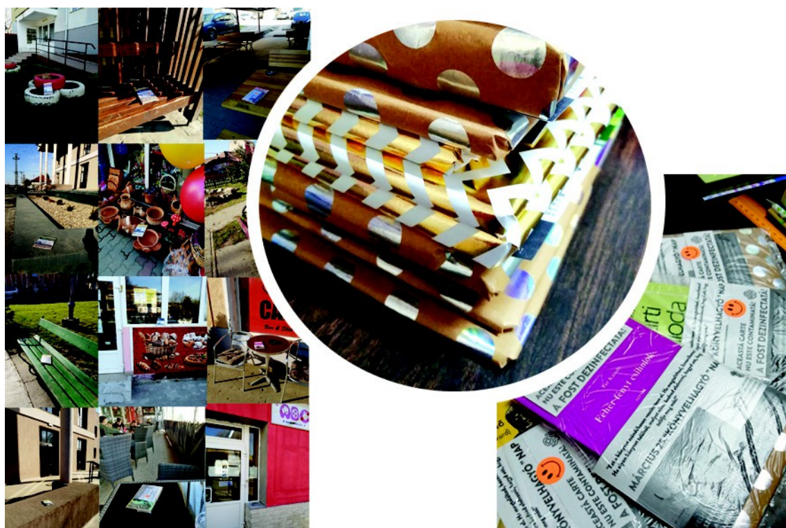
Figura 32 . – Poze despre cărți ”pierdute” ( stânga ), cărțiile pentru eveniment ( dreapta ), (2021, 2022)