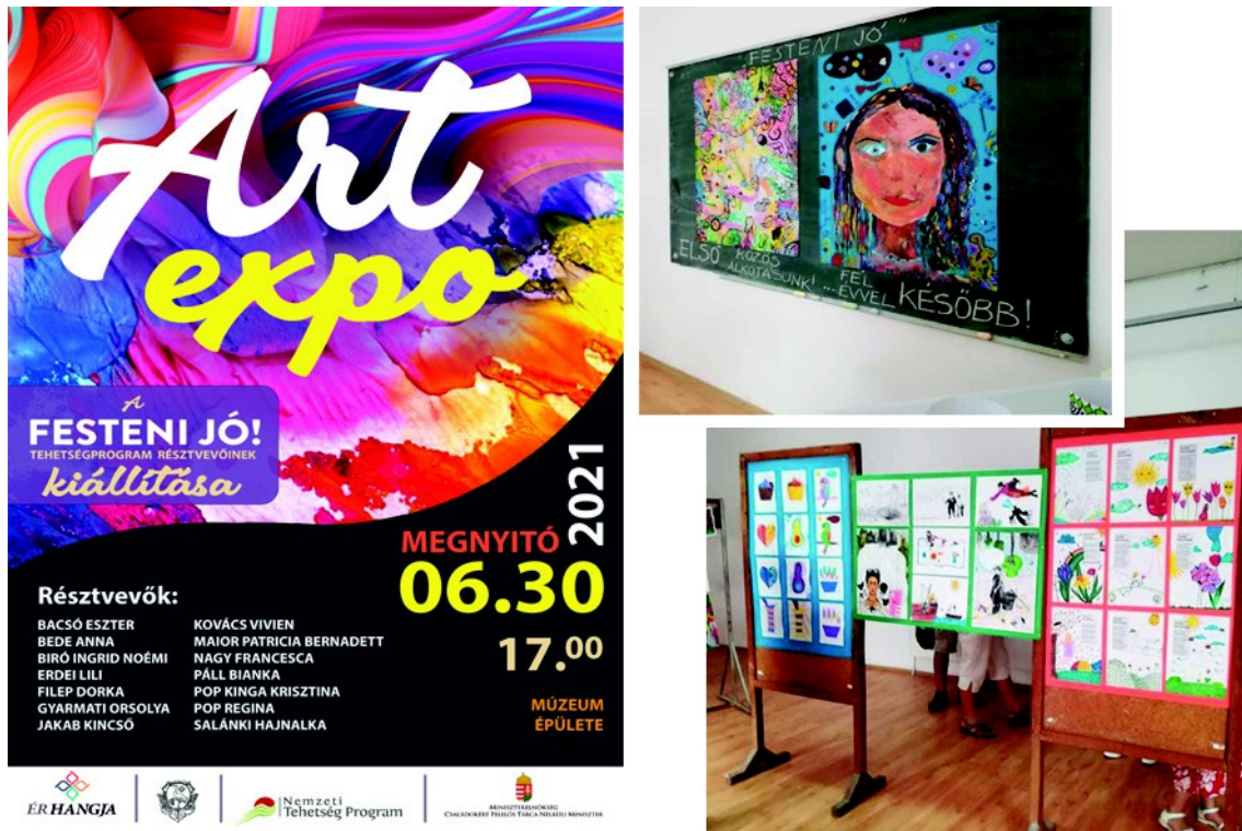
Figura 23 . –Afișul expoziției (stânga), lucrările copiilor la expoziție (dreapta), (2021)