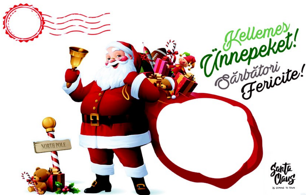
Figura 3. – Fișa inițială pentru joc (2021)