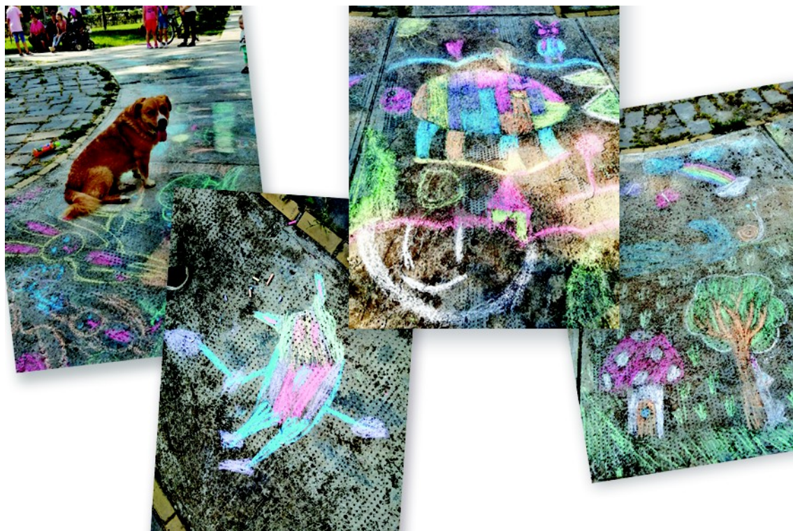
Figura 14. – Desenele copiilor (și un musafir ☺) (2022)