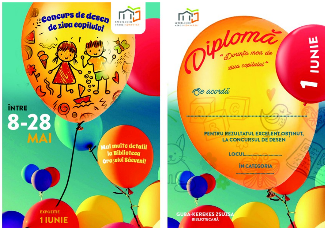
Figura 15 . – Afișul pentru concurs de desen ( stânga ), diploma pentru concurs ( dreapta ), (2023)