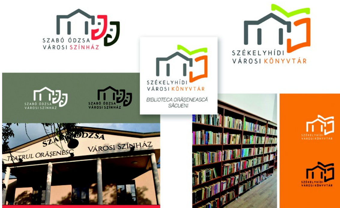
Figura 19 . – Logoul creat pentru teatru ( stânga ), Logoul creat pentru bibliotecă ( dreapta ), (2022)