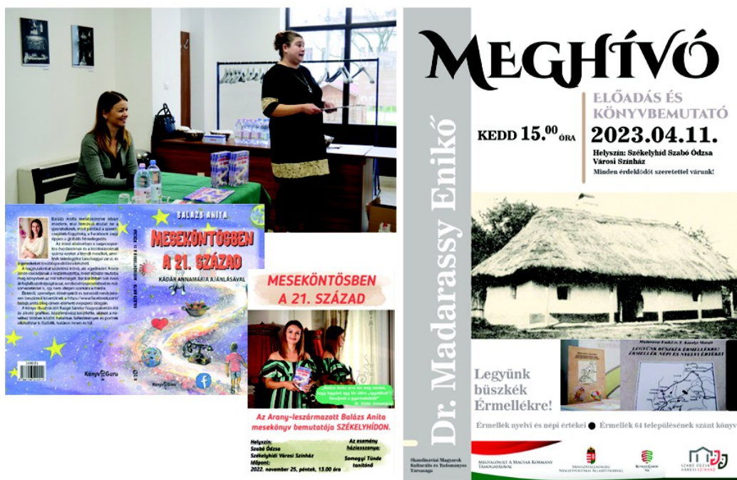
Figura 29 . – Lansare de carte ( stânga, sus : ), a Anitei Balázs, afișul pentru eveniment ( stânga, jos, făcut, de Anita Balázs ), coperta de carte, ( stânga, jos, ilustrații de Buzgó Sándor ) (2022), afișul pentru lansare de carte a lui Elek D. Mészáros ( dreapta ), (2023)