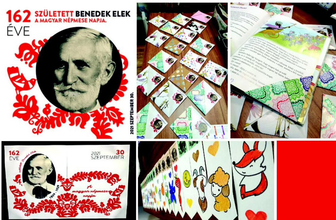
Figura 33 . – Afiș, și etichetă pentru eveniment ( stânga ), diferite marcaje de cărți, făcut special pentru eveniment ( dreapta ), (2021, 2022)