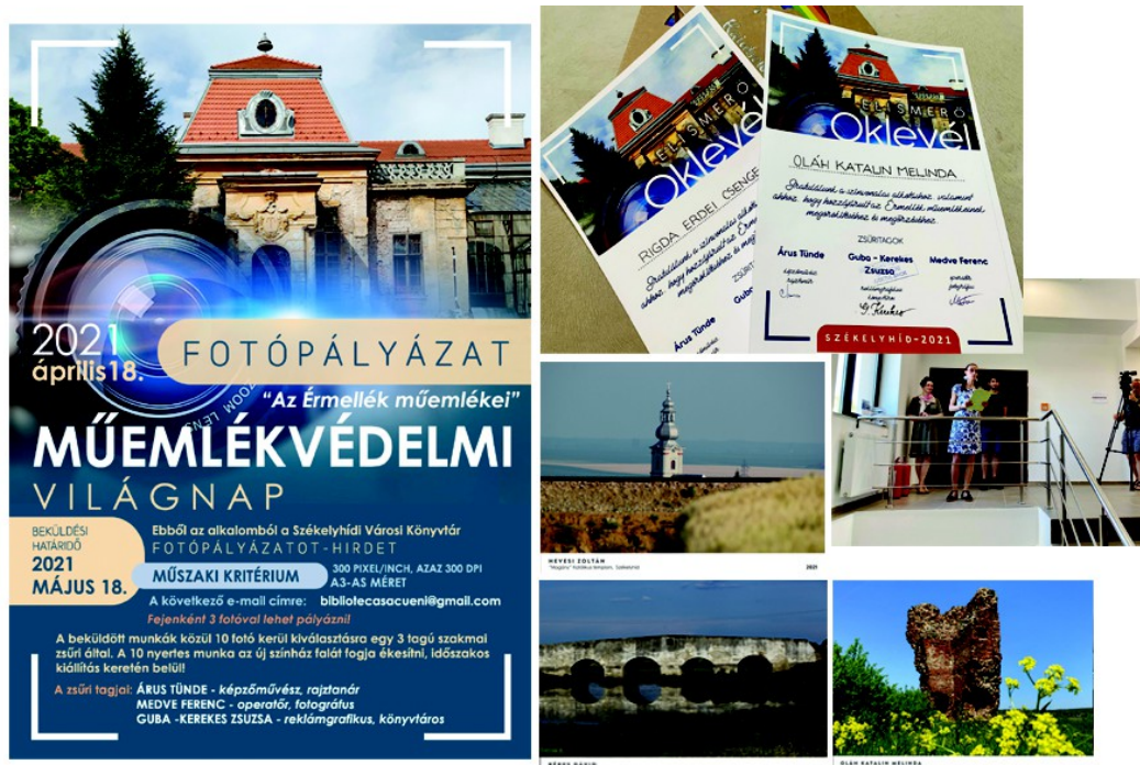
Figura 30 . – Afiș pentru concurs ( stânga ), diplomă pentru participanți, ( dreapta, sus ), Vernisajul expoziției ( dreapta ), trei fotografii câștigătoare dintre lucrări cele mai bune, Biserica catolică , de Zoltán Hevesi, Podul din Sălăcea , de Dávid Béres, Cetatea din Sălard , de Katalin Melinda Oláh, (2021)