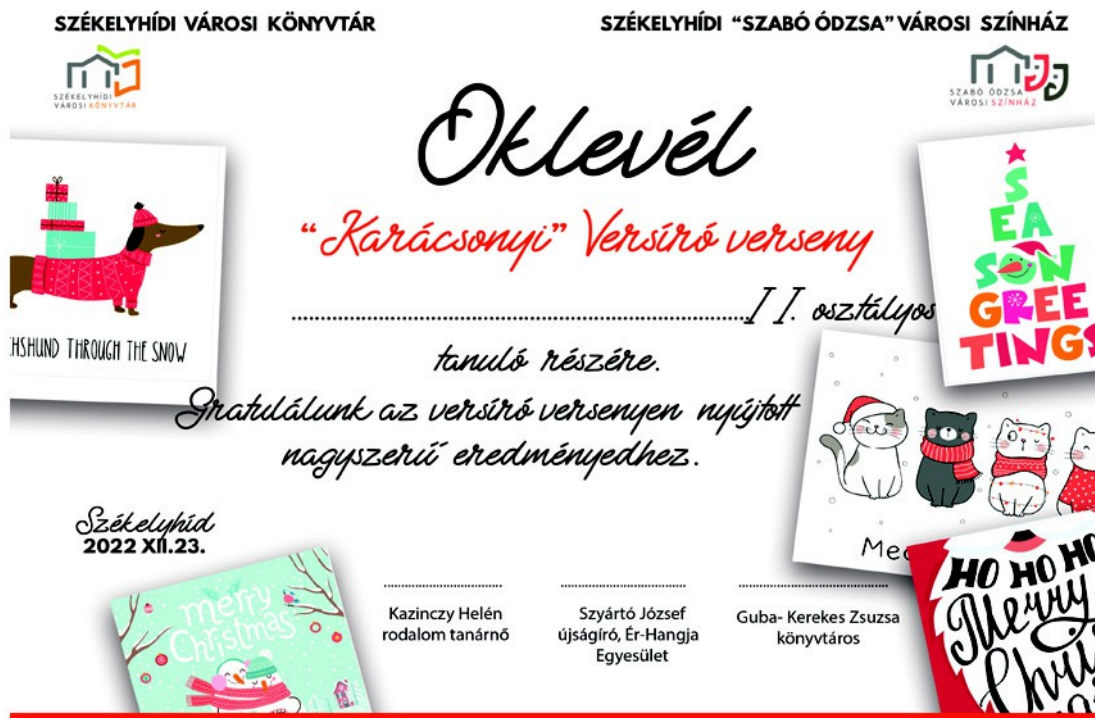
Figura 5. – Diplomă pentru participanții la jocului, (2022)