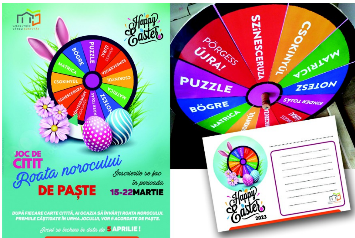
Figura 11.- Afișul pentru joc (stânga), ”roata de noroc” și fișa pentru participanți (dreapta), (2023)