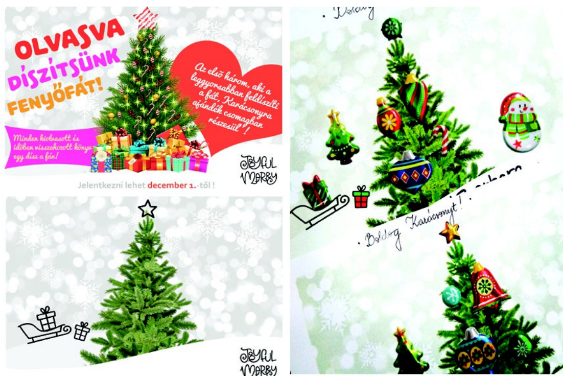
Figura 1. – Afişul și fişa inițială(stânga), fişa completată(dreapta) pentru joc (2020)