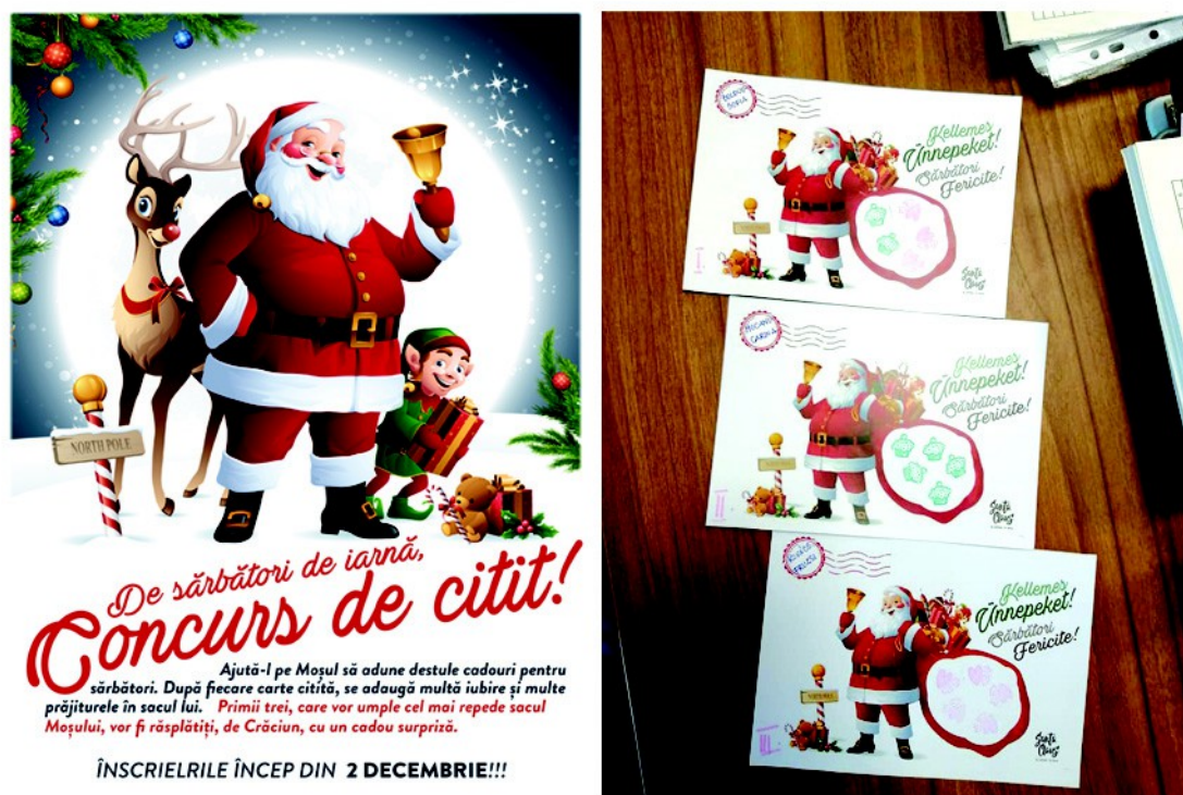
Figura 2. – Afişul (stânga)și fişa completată pentru joc (dreapta) (2021)