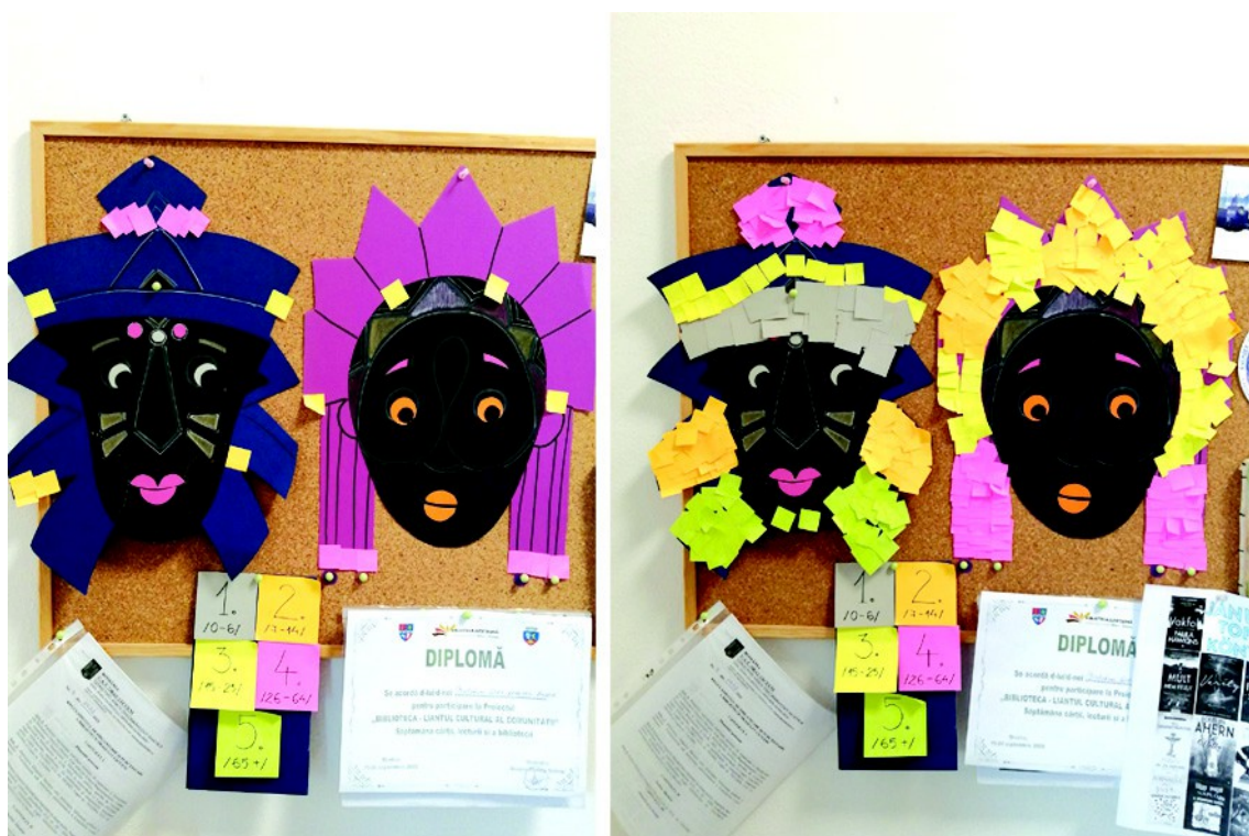
Figura 6. – Măștile la începutul jocului (stânga), măștile la sfârșitul jocului (dreapta), (2023)