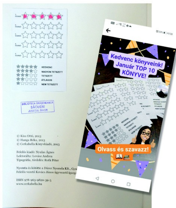
Figura 20 . – Fișa cu stelute ( stânga ), pliantul online și poză actuală din carte ( dreapta ), (2021)