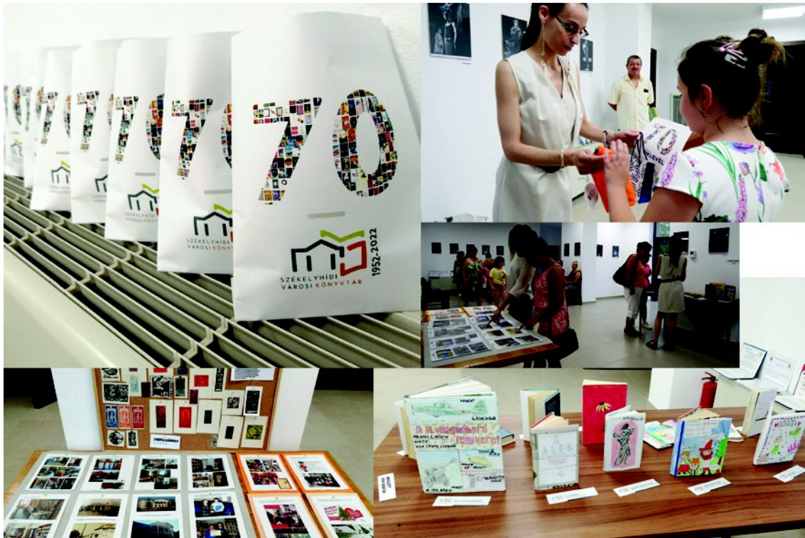
Figura 27 . – Momente din evenimentele festive de aniversarea bibliotecii, fotografie (dreapta, sus) de Szyártó József (2022)