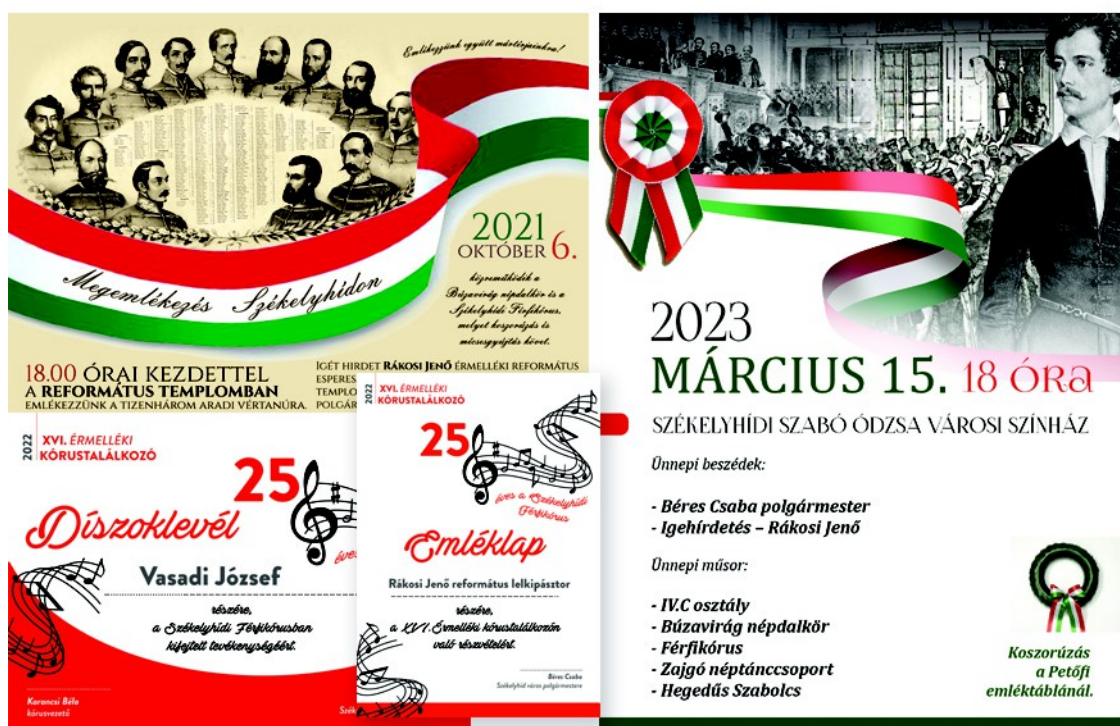
Figura 34 . – Afiș și diplomă pentru evenimente culturale ( stânga ) (2021, 2022), afiș pentru 15 martie ( dreapta ), (2023)