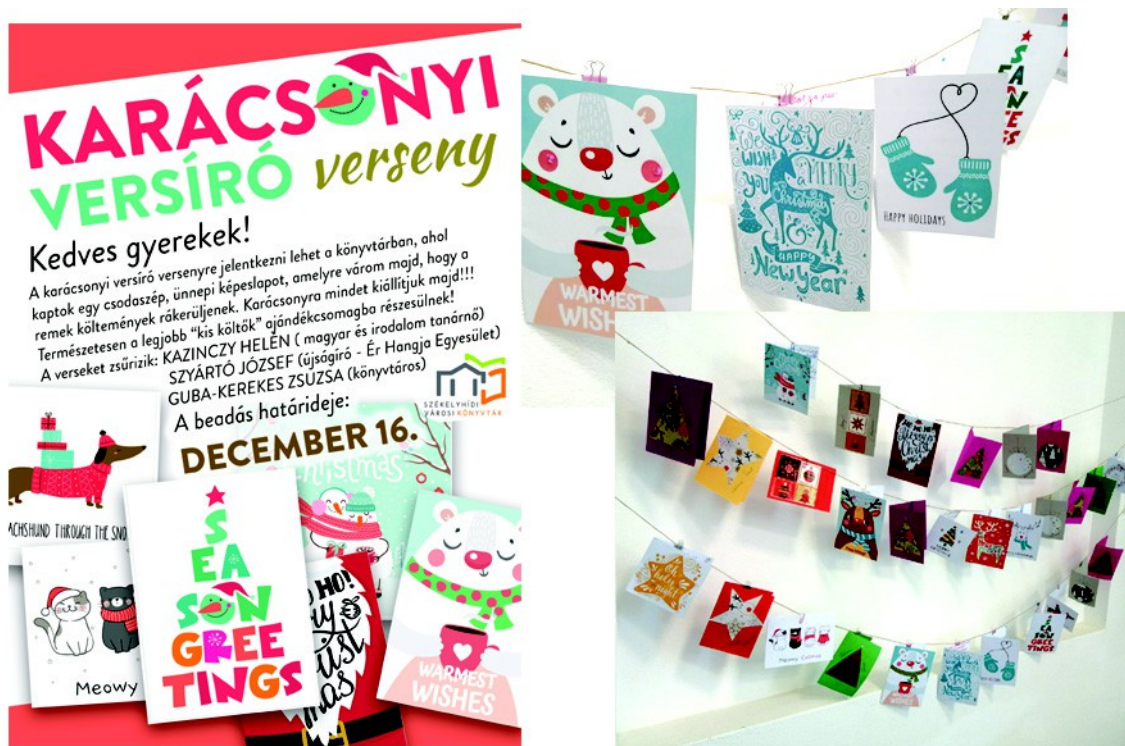
Figura 4. – Afișul (stânga) și poze la expoziție, din lucrarea participanților (dreapta), (2022)