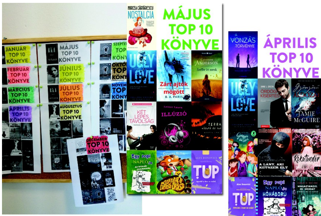
Figura 21 . – Lista cărților top 10 din anul trecut ( stânga ), lista cărților top 10 din mai și aprilie, versiunea online ( dreapta ), (2022, 2023)