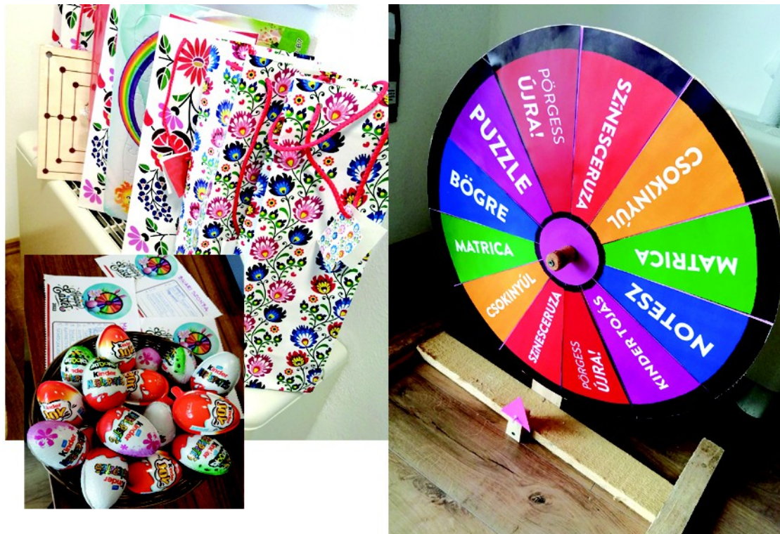
Figura 12. – Cadourile pentru câștigătorii (stânga), ”roata de noroc” (dreapta), (2023)