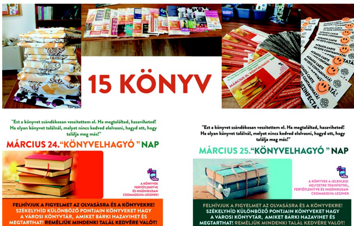
Figura 31 . –Afișe pentru eveniment ( jos ), cărțiile pentru eveniment, și pliante, etichete ( sus ), (2021, 2022)