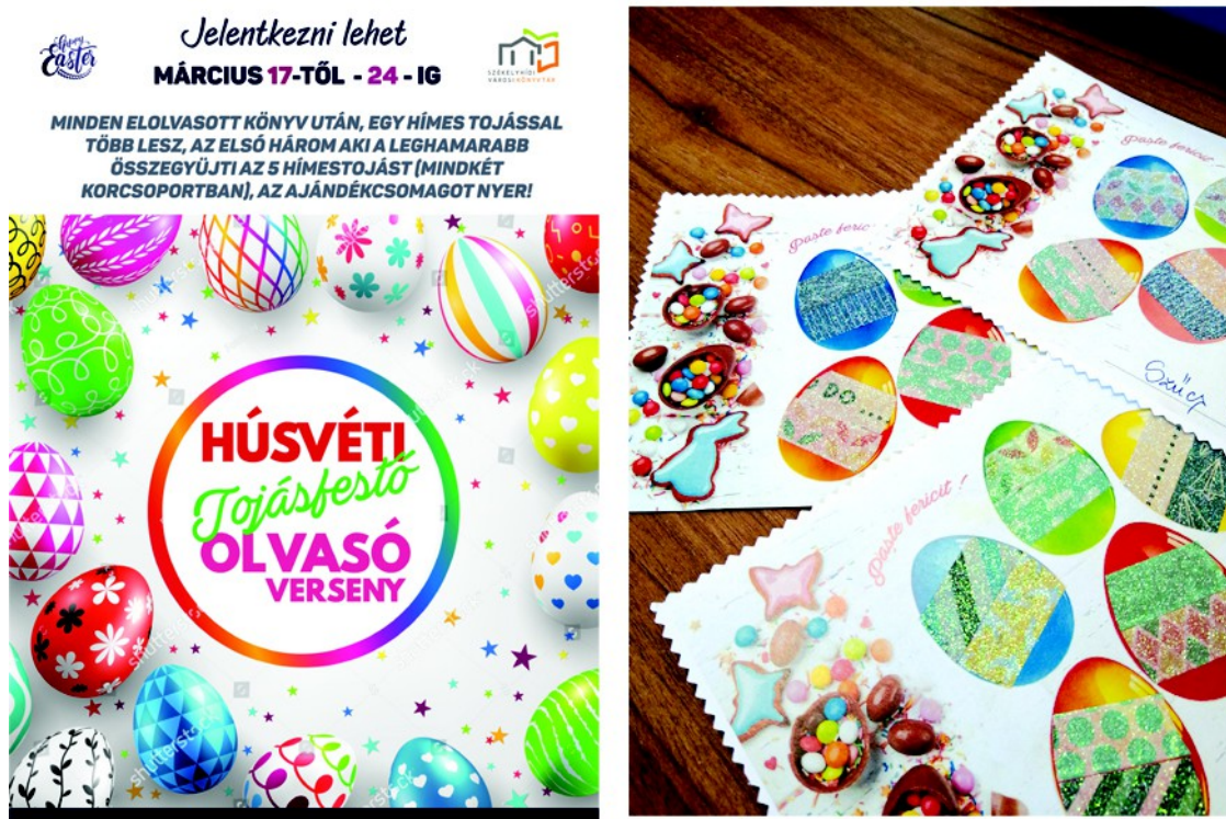
Figura 9. – Afișul pentru joc (stânga), fișe decorate (dreapta), (2022)