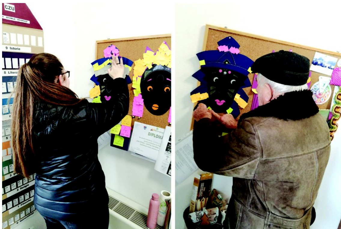
Figura 7. – Decorarea măștilor de cititori (2023)