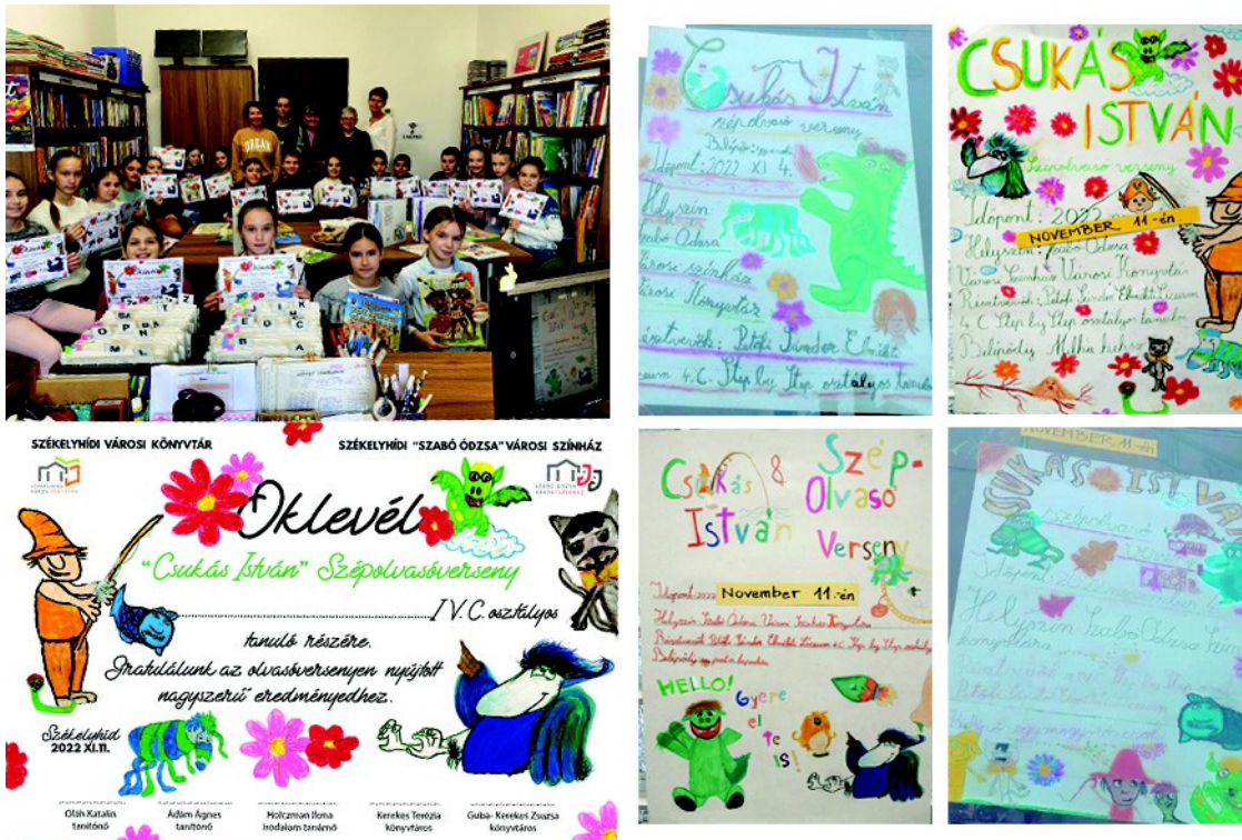
Figura 18 . – Diploma pentru concurs (stânga), afişe făcute de copiii pentru concurs (dreapta), (2022)