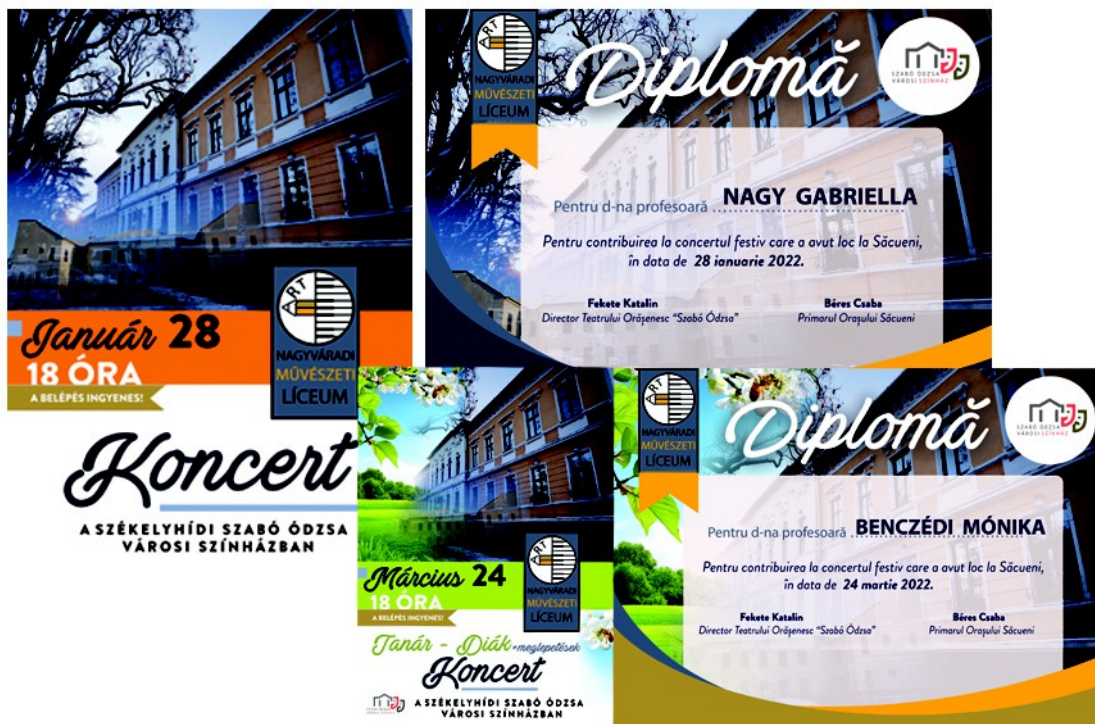
Figura 35 . – Afiș, și diplomă pentru festivitatea de elevilor de liceu de artă, (2022).