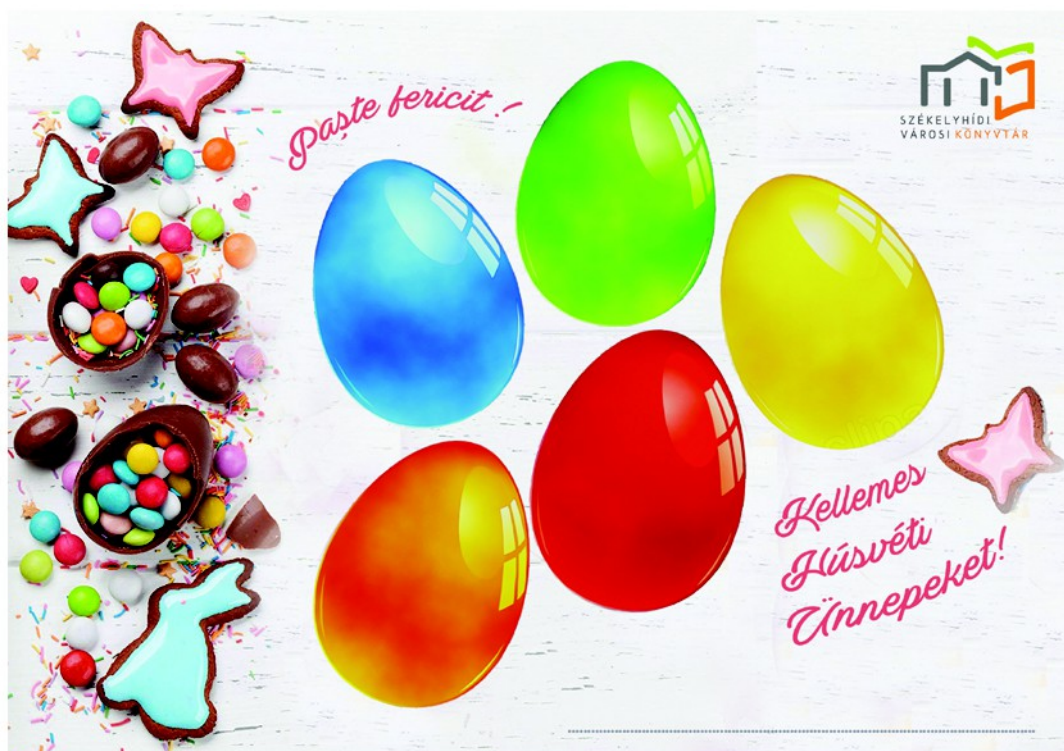
Figura 10. – Fișa inițială pentru joc (2022)