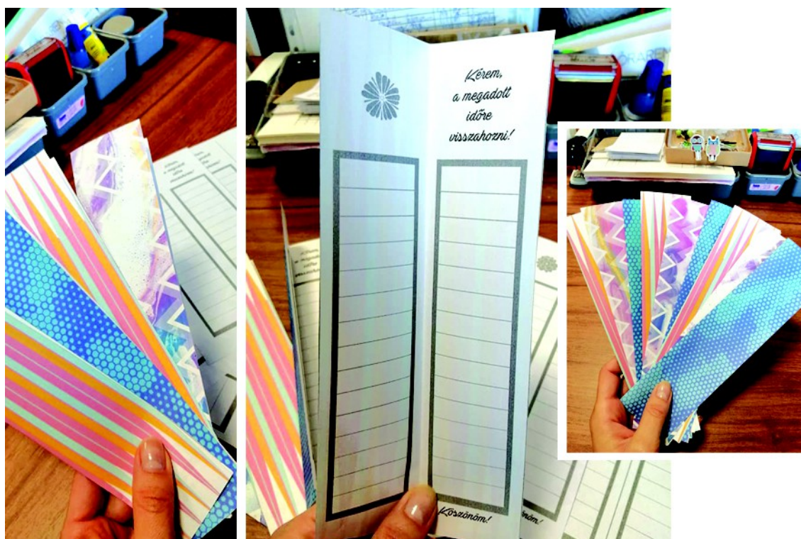
Figura 22 . – Marcaj de carte pliabil, (2021)